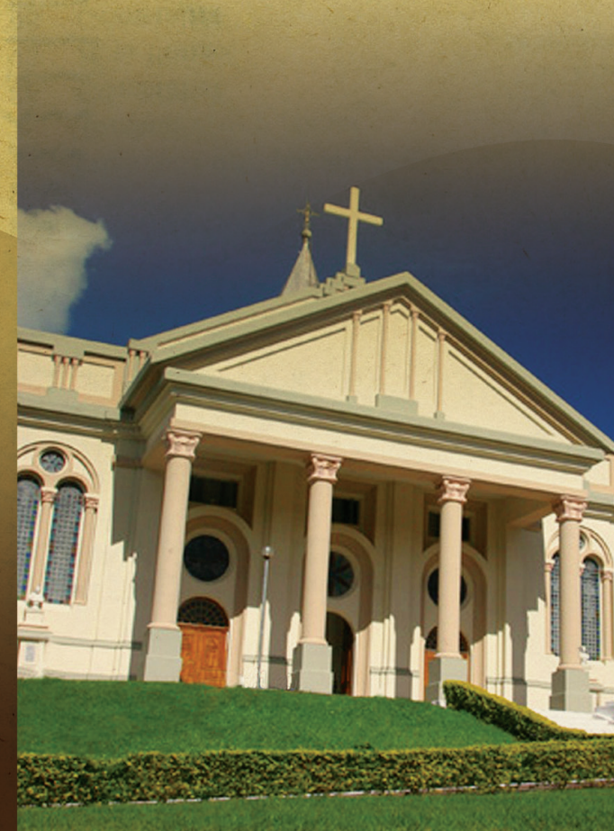
VALE VÊNETO - SÃO JOÃO DO POLÊSINE - RS